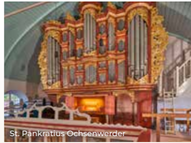
St. Pankratius Ochsenwerder