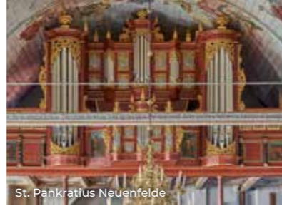
St. Pankratius Neuenfelde