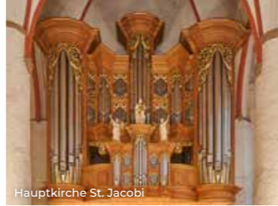
Hauptkirche St. Jacobi